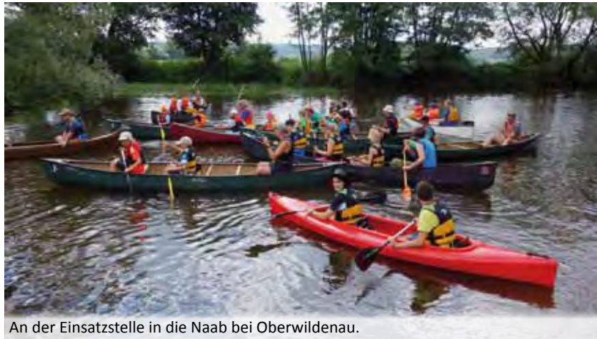
An der Einsatzstelle in die Naab bei Oberwildenaubis.