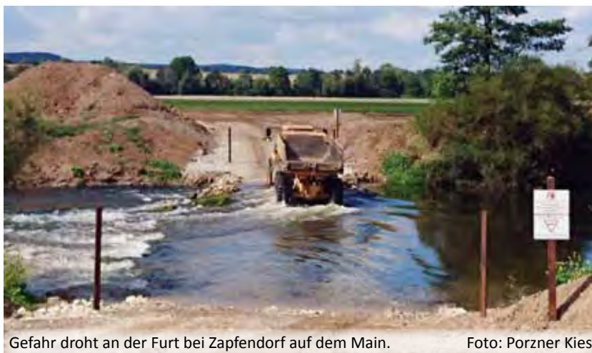
Gefahr droht an der Furt bei Zapfendorf auf dem Main.

Aktuelle Infos + Onlinemeldung- unter www.kanu-bayern.de/ Umwelt/Gewaesser-Info/ Gewaessermeldungen