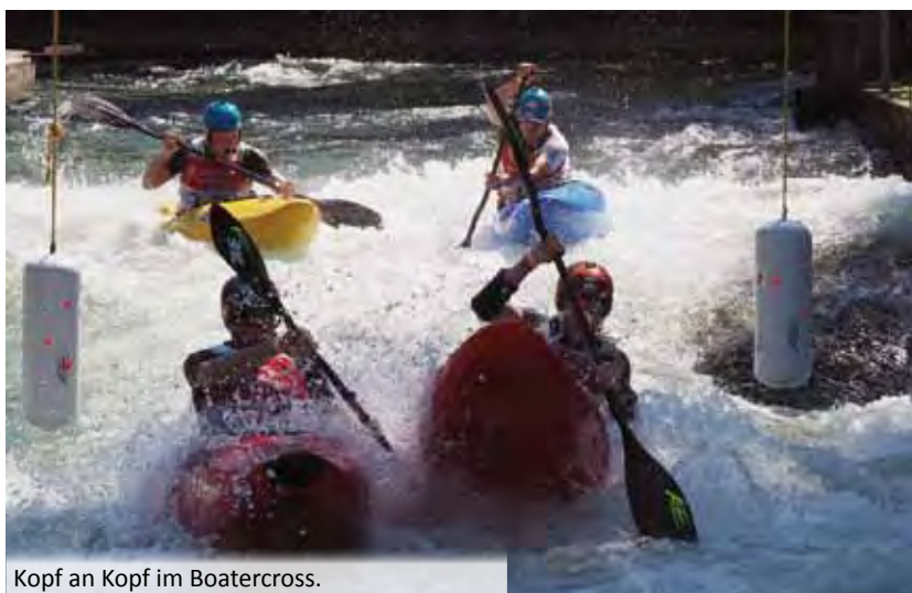
Kopf an Kopf im Boatercross.

Rund 30 Starter aus der ganzen Republik waren angereist. Gefahren