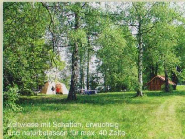
Zeltwiese mit Schatten, urwüchsig und naturbelassen für max. 40 Zelte

Weitere Infos unter www.dasblauland.de Webcam unter www.seehausen-am-staffelsee.de