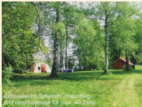
Zeltwiese mit Schatten, urwüchsig und naturbelassen für max. 40 Zelte

Weitere Infos unter www.dasblauland.de Webcam unter www.seehausen-am-staffelsee.de